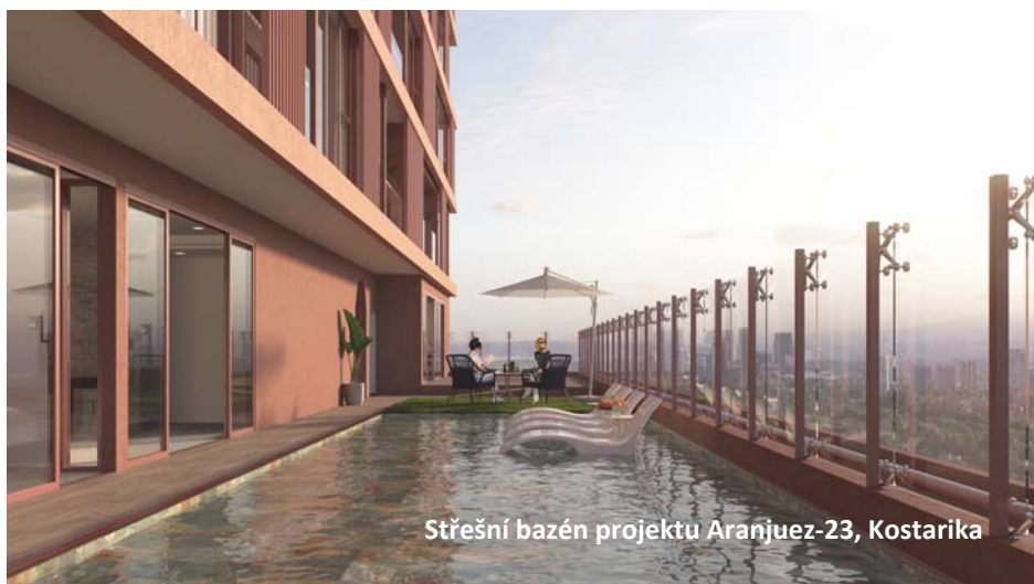
Střešní bazén projektu Aranjuez-23, Kostarika

UDI Group v Kostarice postaví 23podlažní bytový dům se 136 byty o velikostech od 1+kk až po 3+kk. Nejmenší byty mají 39 m 2 . Pohodlné a moderní městské bydlení ale zajišťuje hlavně společné vybavení domu, které je určeno pouze pro jeho obyvatele. Samozřejmostí je střešní bazén s barem,