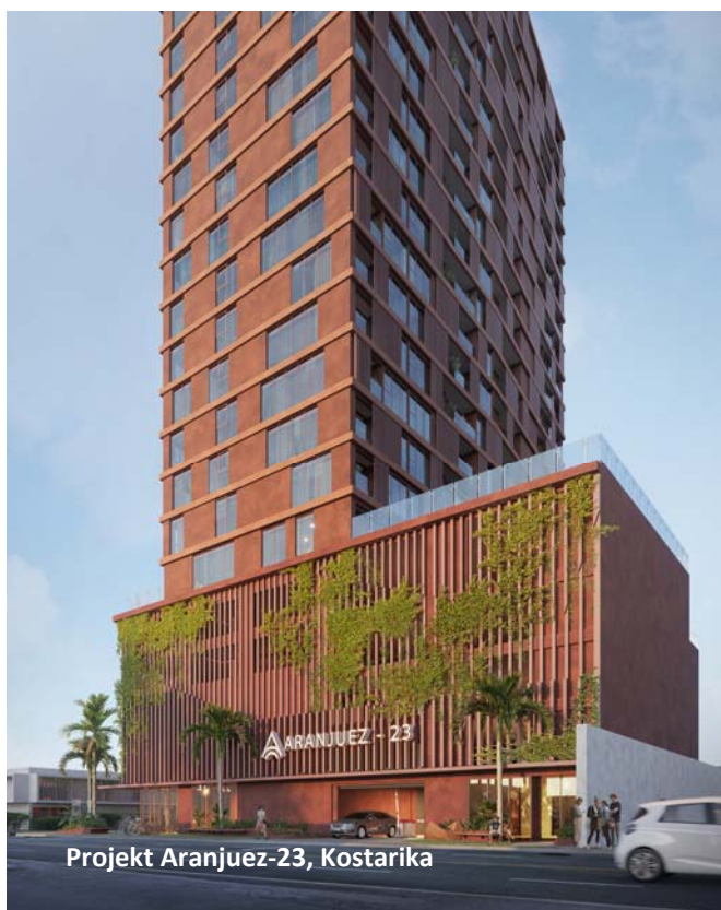
Projekt Aranjuez-23, Kostarika

Kostarika i Panama jsou bezpečné demokratické státy, nejstabilnější v regionu a patří také k zemím s nejrychlejším ekonomickým růstem. Také realitní trh zde roste a má rychlou návratnost. Výnos z pronájmu se v obou zemích pohybuje na úrovni 6,5 procenta což je téměř dvojnásobek oproti Praze. Je zde příznivá daňová politika, v Panamě jsou například nemovitosti prvních deset let osvobozeny od daně z nemovitosti. V obou zemích je možné při určité investici do nemovitostí získat povolení k pobytu. Obě země patří mezi nejlépe hodnocené destinace pro strávení důchodu. Renomovaný časopis International Living letos zařadil Panamu v celosvětovém měřítku na 4. místo a Kostarika je dokonce vítězem tohoto prestižního celosvětového žebříčku.